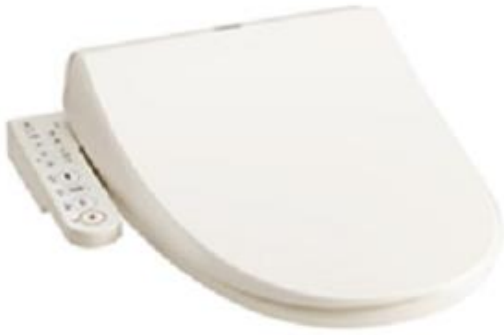
クリーンウォッシュ